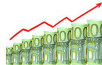
Maximaler Gewinn—dennoch ruhig schlafen!