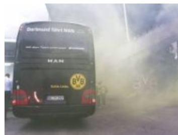
LIVE! Angriff auf BVB-Bus - Schmelzer beginnt...