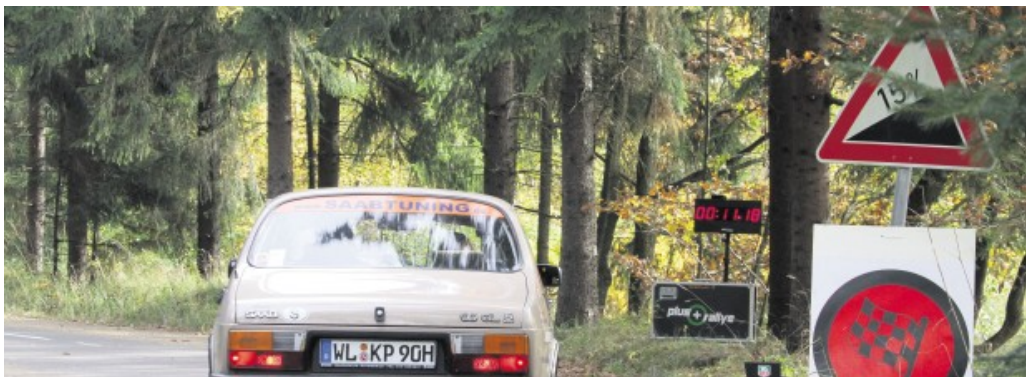
Attendorn wird im kommenden Jahr Start und Ziel der Oldtimer-Rallye „Sauerland Klassik“

Attendorn. Im kommenden Jahr findet erstmals die „Sauerland Klassik“ statt. Dabei handelt es sich um dreitägige Rallye für Oldtimer, bei der es nicht um Höchstgeschwindigkeit, sondern um Präzision geht. Start- und Zielort wird Attendorn sein.