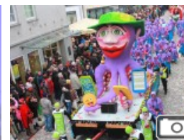
Karneval Veilchendienstag in Attendorn