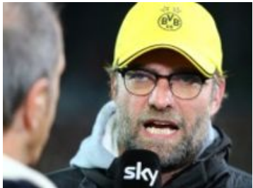
BVB-Trainer Klopp ärgert sich über Sky -...