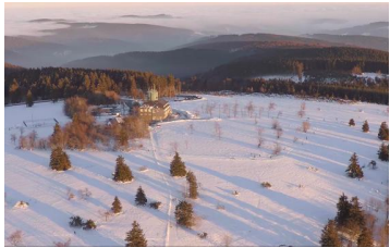
Inversionswetterlage im Hochsauerland