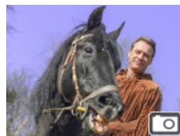
Elspe-Festival Neuer Old Shatterhand in Elspe