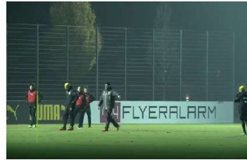
BVB muss Bayern-Verfolger Wolfsburg schlagen