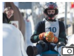
Eisbob-WM Eisbob-WM in Winterberg